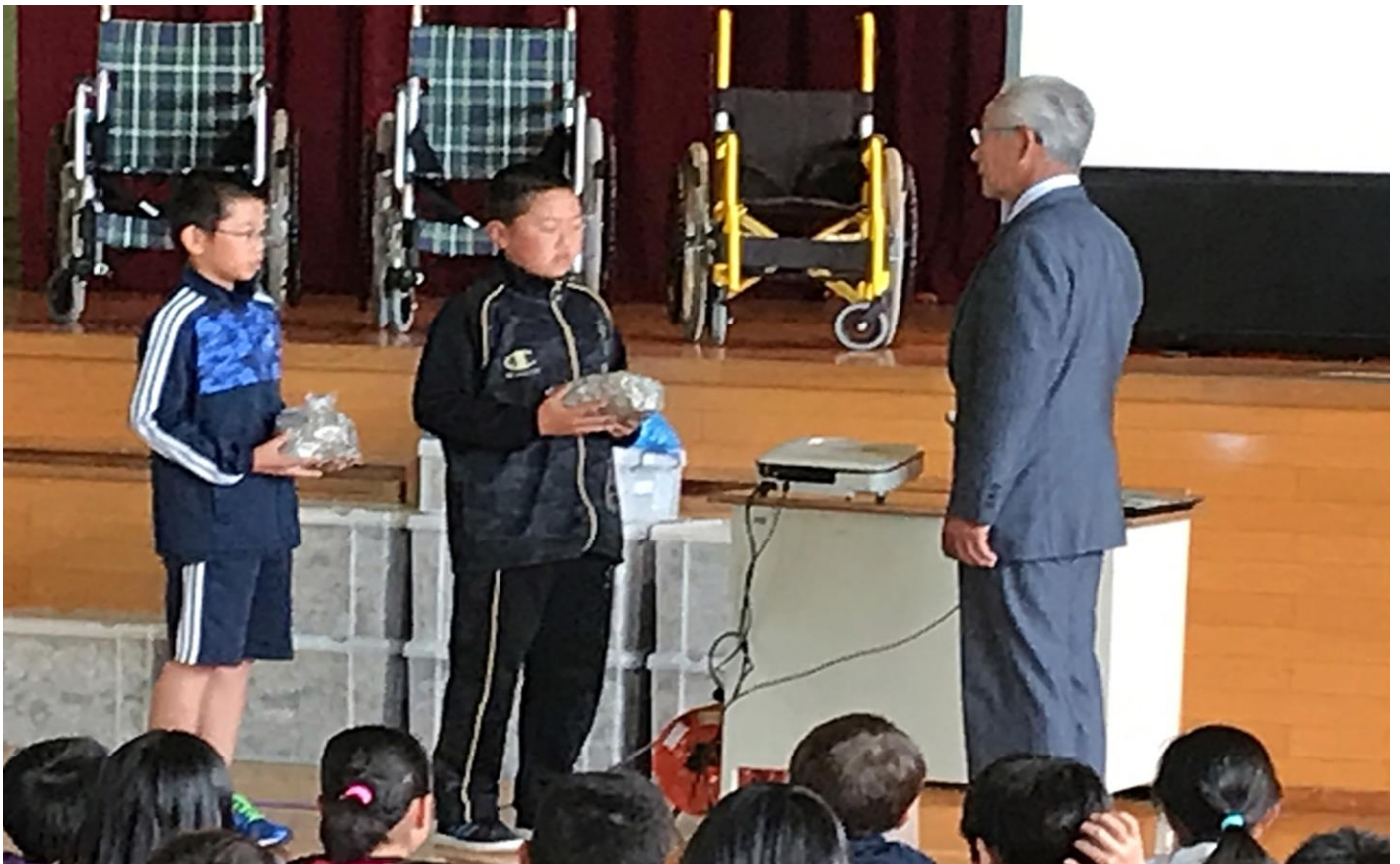
平成30年6月11日（月） 西海小学校 プルタブ贈呈式の様子