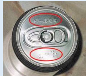
点字付きアルコール缶飲料