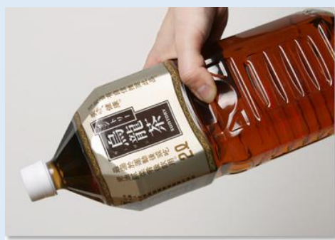
持ち手がくぼんだペットボトル