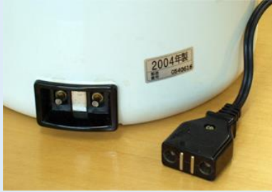
マグネット式コンセントポッド